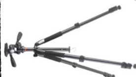
CAMÉRA + MICRO